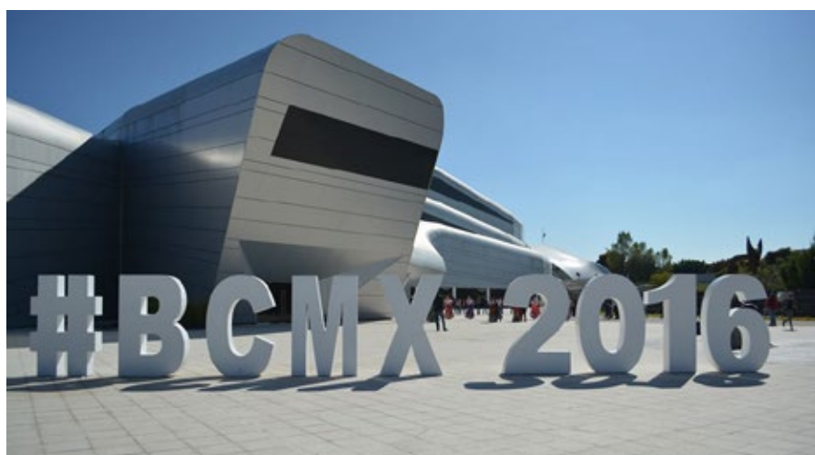
Palcco Guadalajara vuelve a ser sede en la segunda edición