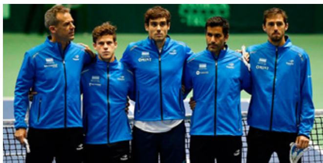
El equipo argentino se medirá ante Colombia en la serie repechaje de Copa Davis

Por su parte, la Selección Argentina de básquet se mide ante México y Puerto Rico en el inicio de la segunda fase de las Eliminatorias del Mundial de China con la obligación de ganar ambos partidos para quedar cerca de clasificar a la gran cita del 2019. TyC Sports transmitirá ambos encuentros en una cobertura especial con móviles en vivo,